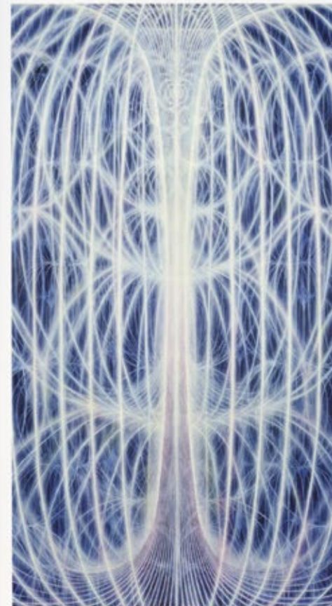
Alex Grey, Universal Mind Lattice Öl auf Leinwand, 60 x 210 cm, 1981

Alex: Diese Bildsprache kommt als Vision. Manchmal ist es mir möglich, einen Einblick in eine röntgenartige Dimension zu haben. Ich stelle mir glasartige anatomische Schichten vor weil damit universelle Qualitäten des menschlichen Wesens – glasig oder durchsichtig – dargestellt werden und die Benennung der Rasse oder des Geschlechts vermieden wird. Indem eine eher androgyne Figur als Sacred Mirror dargestellt wird, entfernt sich der Betrachter von seiner einschränkenden «Selbstheit».