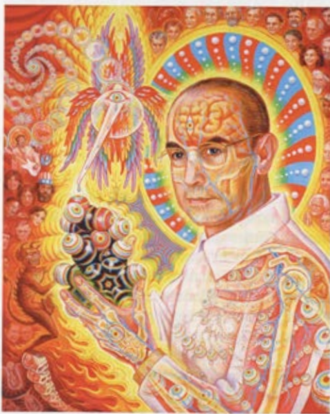
Alex Grey, St. Albert and the LSD Revelation Revolution , Öl auf Holz, 61 x 76,2 cm, 2006

wurden zur Grundlage unserer Leben. Wir hatten eine Erfahrung, die wir als das «Universelle Bewusstseinsraster» bezeichnen. Versetzen mit Augenbinden lagen wir auf dem Bett und nahmen eine heroische Dosis LSD. Unsere Körper lösten sich auf und verwandelten sich zu ringförmigen Lichtfontänen. (...) Die Energie, die durch die verschiedenen Ringe in unsere Zellen strömte, war Liebesenergie. Intensiv und ekstatisch. Wir waren Teil eines Netzwerks von Liebesenergie, das alle Wesen und alle Dinge vereinte. Das ist wahre Realität. Wir sind alle auf einer sehr grundlegenden ursprünglichen Ebene miteinander verbunden, diese Verbundenheit ist der Energiekörper des Kosmos – und jeder einzelne von uns ist ein wesentlicher Teil in diesem grenzenlosen unendlichen Netzwerk. Es erstaunte mich, dass