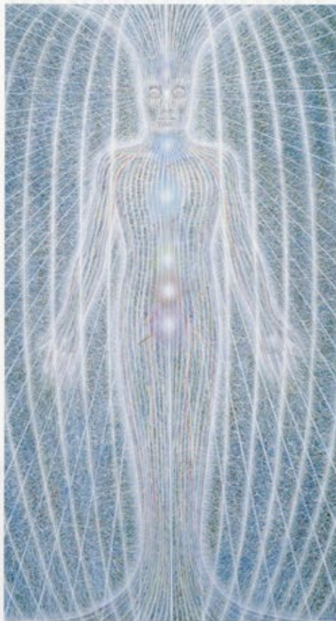
Alex Grey, Spiritual Energy Öl auf Leinwand, 60 x 210 cm, 1986

gie, Friede und Liebe, hemmungslose, kreative Selbstverwirklichung und absolute Toleranz sind Grundmotive der bunten Truppe) ist eine brillante Zurschaustellung von Einheit und individuellem kreativen Ausdruck. Wecke Deinen kreativen Prozess indem Du zuerst Dich selbst erkennst, was eine spirituelle Suche erfordert. Wie kann Deine Kunst Dich zu einer besseren Person machen? Kunst kann eine spirituelle Praxis sein. Weise auf eine spirituelle Dimension hin die universell genug ist um alle Weisheitstraditionen mit einzuschliessen und als ikonisch erkennbar ist.