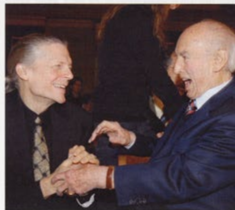
Alex Grey mit Albert Hofmann Basel 2006

Alex Greys grosse Wertschätzung Albert Hofmanns und seiner Entdeckung kommt in seinem 2005 entstandenen Porträt «St. Albert and the LSD Revelation Revolution» zum Ausdruck.